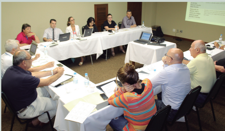
Reunião realizada pelo CNB/RS na cidade de Canela definiu o plano de ações da entidade para a nova gestão