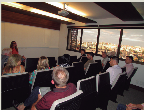
Participantes da 1ª edição do projeto Grupo de Estudos Notariais se reúnem na sede do CNB/RS para debater o tema Prudência Notarial

A primeira edição do Grupo de Estudos Notariais, criado pelo Colégio Notarial do Rio Grande do Sul para discutir doutrina notarial superou todas as expectativas.