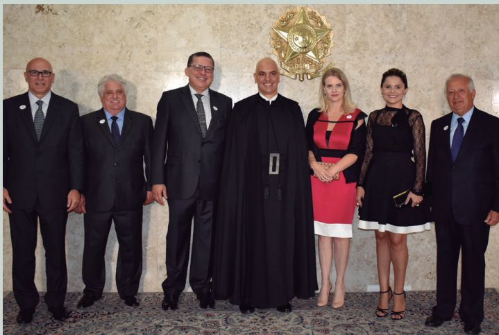
Notários e Registradores posam ao lado do novo ministro do STF Alexandre de Moraes durante cerimônia de posse em Brasília

Presidente da entidade se encontrou com membros do Executivo e Judiciário Federal