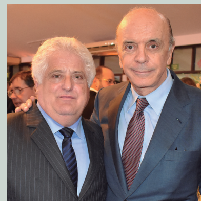
Na cerimônia, o presidente do CNB/RS esteve ao lado de autoridades como os ministros do STF, Gilmar Mendes e Ricardo Lewandowski, além do senador José Serra (PSDB/SP)