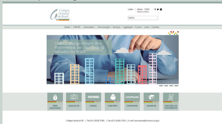
Novo portal institucional do Notariado gaúcho está muito mais moderno e traz informações completas aos associados;

das discussões. O objetivo é estabelecer uma linha de ação e definir as atividades que a diretoria realizará para beneficiar os associados de todo o Rio Grande do Sul.